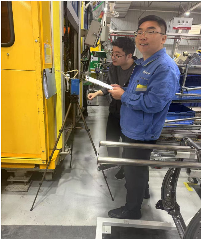
机器人焊接工作站采样