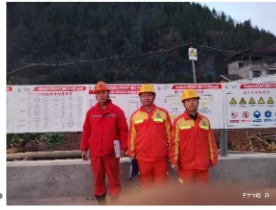
试油气测试保障中心压裂队合影