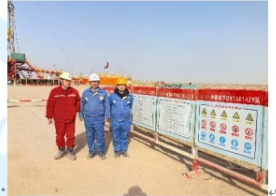
西北 15104 队合影