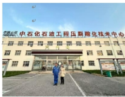
压裂酸化技术中心合影