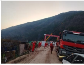
试油气测试保障中心压裂队