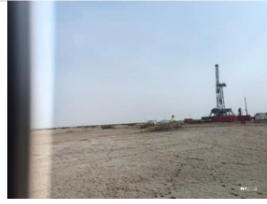
西北 15010 队