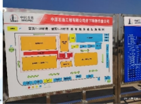
压裂连油保障中心平面图