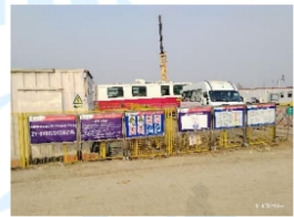
试油 815 队