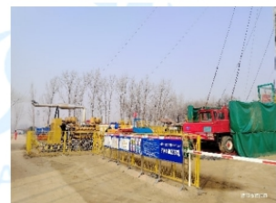
中原修井队作业现场