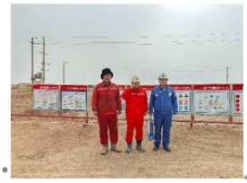
西北 15010 队合影