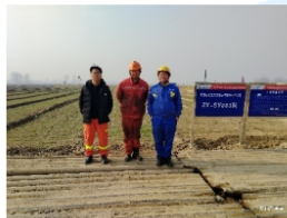
试油 803 队合影