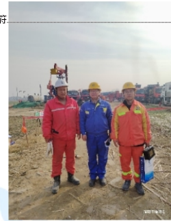
中原区压裂队合影