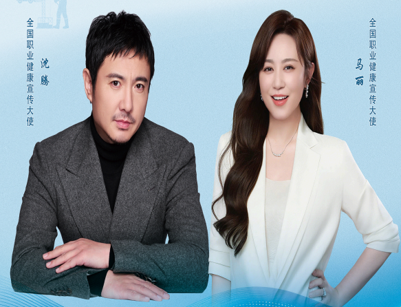
全国职业健康宣传大使 沈腾