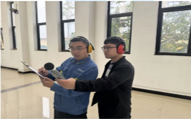
反冲洗泵房噪声测量